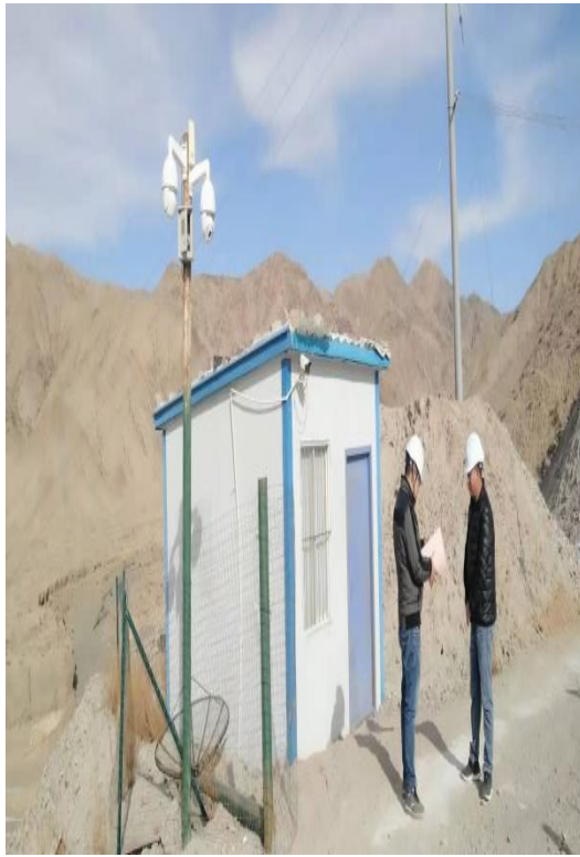
库区北东侧值班房