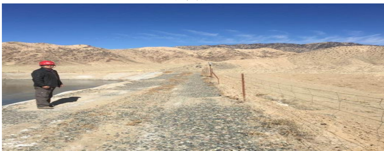
东侧坝顶围栏及照明设施