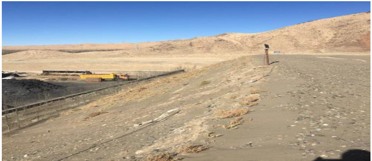
西侧坝体及相邻选厂