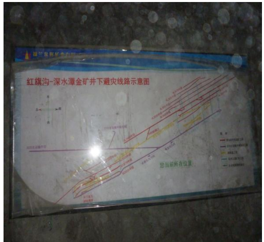
井下避灾线路示意图