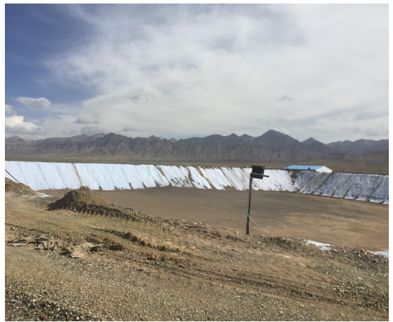
库区东侧照明设施