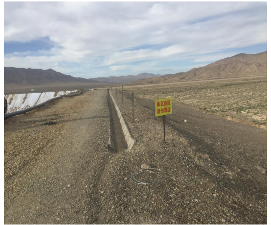
坝顶道路及排水沟