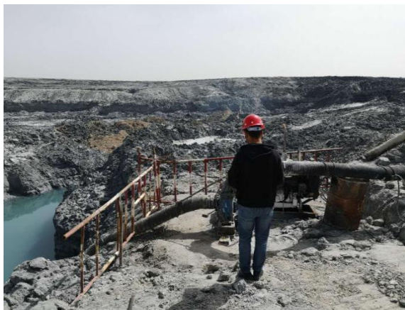
晶间卤水排卤泵站