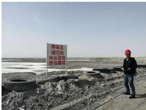
道路挡墙及警示标志