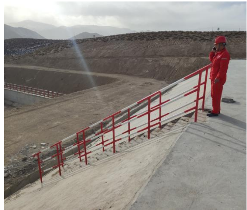
拦挡坝外侧踏步及扶手