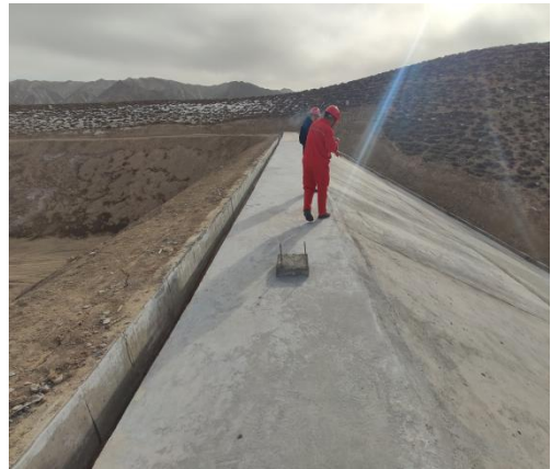
1#副坝位移监测点、坝顶及护坡