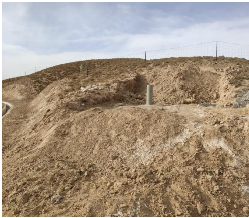
副坝之间的本底井