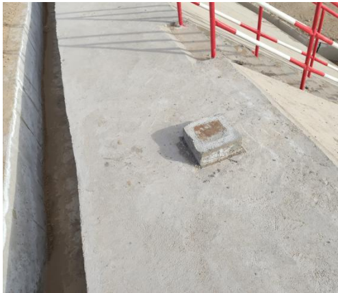
拦挡坝坝顶位移监测点