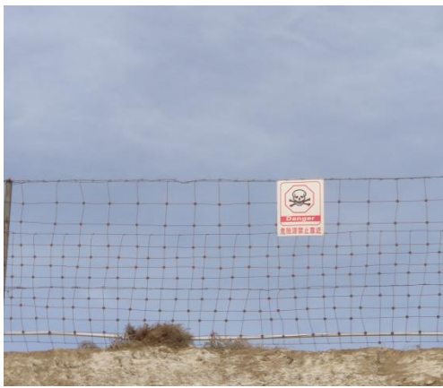
防护围栏及警示标志