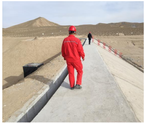
拦挡坝坝顶及护坡