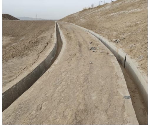
坝顶四周排水沟和截水沟