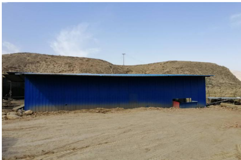
采场北侧工业场地