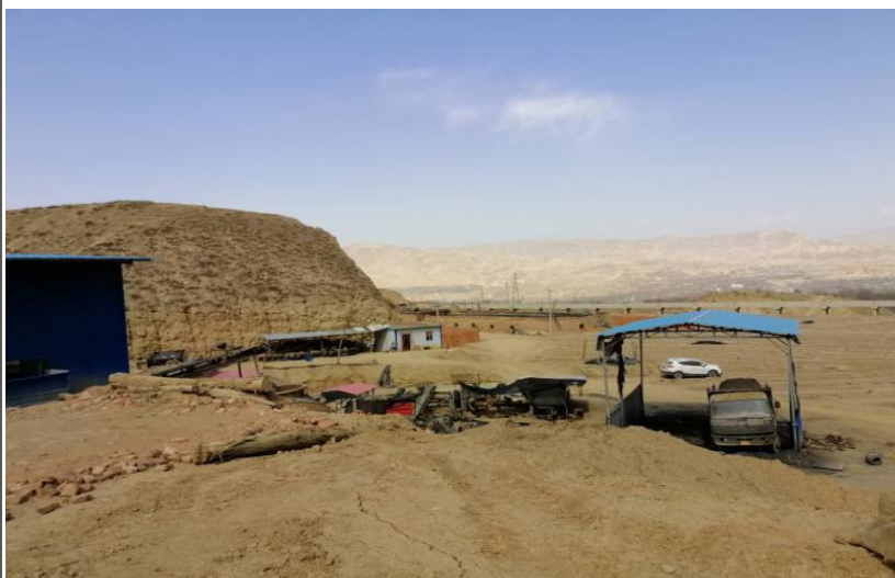
采场北侧制砖生产线