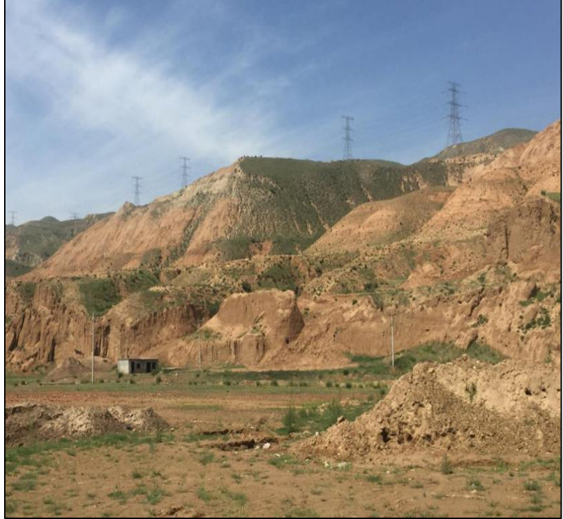
采场全貌 采场东侧红崖子沟河