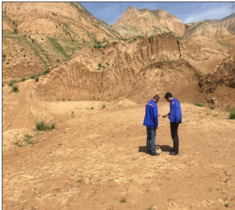
采场现状一 采场现状二