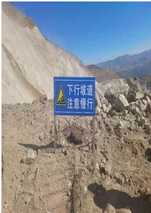
采场道路警示标志