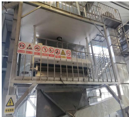
洗涤器及警示标志