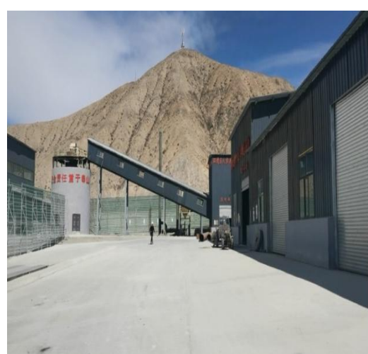
破碎车间/检维修车间