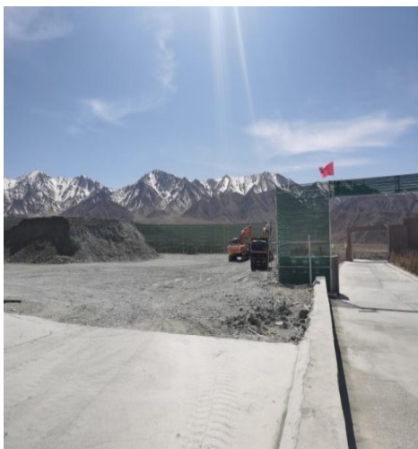
原矿堆场及破碎区入口