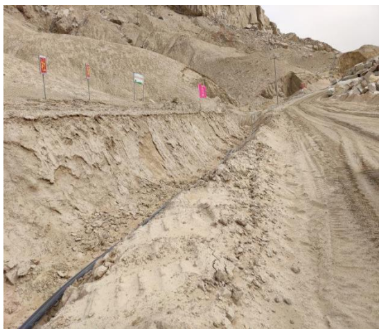
排土场上游截水沟