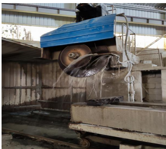
框架式金刚石锯石机